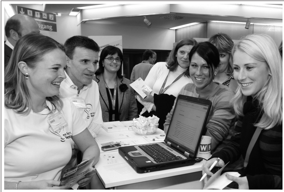
Abb. 5. Die SchreibBAR