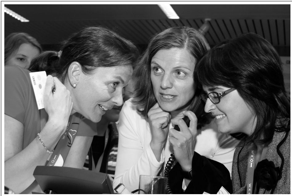
Abb. 6. Die HörBar