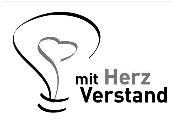
Abb. 2: Das HerzVerstand-Logo