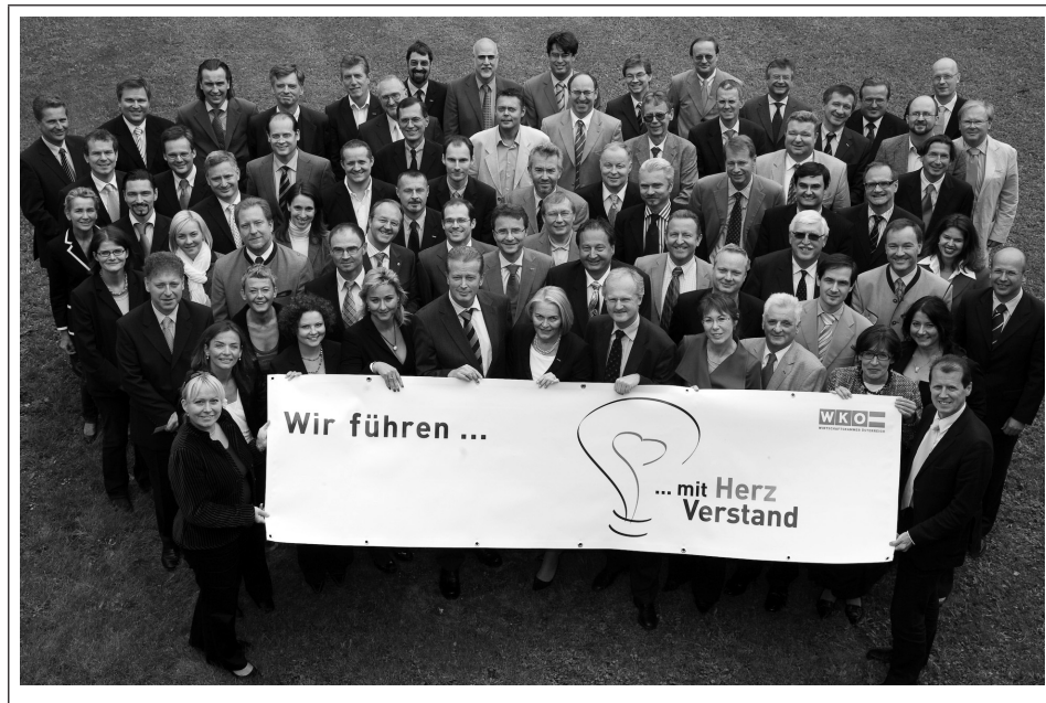
Abb. 4: Die Führungskräfte der WKÖ stehen hinter dem HerzVerstand.

voll in Form selbst einstudierter Sketches vorgestellt. Nächster Schritt: Diskussion und Ergänzung der Ergebnisse in Kleingruppen. Es entstanden viele Ideen, wie das Management HerzVerstand-Verhalten aktiv fördern kann.