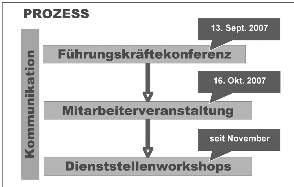
Abb. 3: Der HerzVerstand-Prozess in der WKÖ

Das freigegebene Internal Branding-Konzept sah im September 2007 eine Führungskräftekonferenz und einen Monat später ein großes Mitarbeiter-Kick-off-Event vor. Ab November 2007 waren Workshops in allen Abteilungen geplant, ergänzt durch begleitende interne Kommunikationsmaßnahmen.